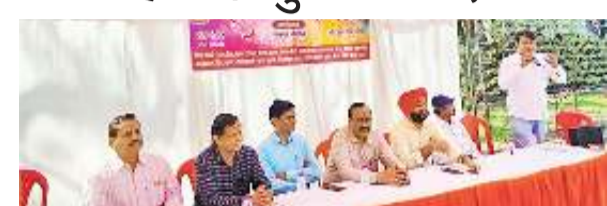
होली मिलन समारोह में मौजूद नगर निगम के अधिकारी व अन्य ● सौ. खट

सफाई मजदूर संघ के होली मिलन समारोह में दीं शुभकामनाएं