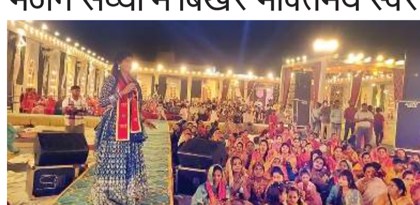
अवधपुरी स्थित प्रेम वाटिका में श्रीश्याम भक्त मंडल समिति की भजन संध्या में प्रस्तुति देती कलाकार